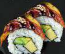
48. Unagi Tamago gegrilde paling, omelet, komkommer, avocado, unagisaus