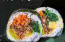
58. Mango Breeze zalm, garnaal, asperge, mango, mangodressing, masago