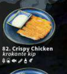
82. Crispy Chicken krokante kip