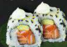
53. Deep-Fried Salmon gefrituurde maki, zalm, wortel, bosui, kimchi mayo