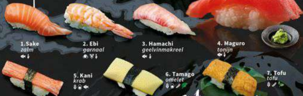
1. Sake zalm