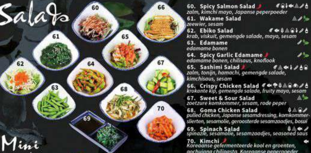
60. Spicy Salmon Salad zalm, kimchi mayo, Japanse peperpoeder