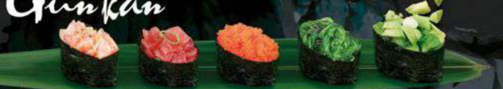
31. Salmon zalm, ponzusaus, sesam