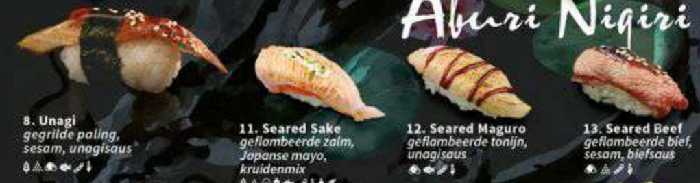
8. Unagi gegrilde paling, sesam, unagisaus