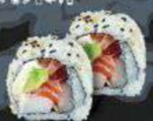
50. Rainbow zalm, tonijn, tamago, komkommer, kimchi mayo