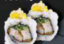
56. Chicken Curry gefrituurde kip, komkommer, kurkuma knoflook mayo