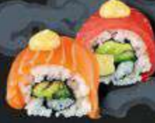
49. Spicy Beef bief, gebakken uitjes, viskuit, bosui, unagisaus