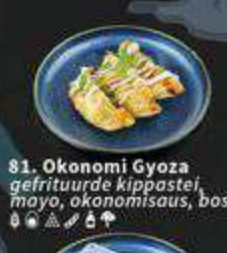
81. Okonomi Gyoza gefrituurde kippastei, mayo, okonomisaus, bosui