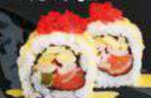
57. Salmon Mango Fiësta zalm, sjalot, avocado, ponzusaus, mangopuree, viskuit