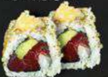
54. Sake Wasabi zalm, avocado, wasabi mayo, sesam