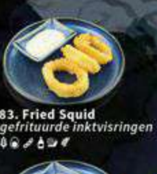
83. Fried Squid gefrituurde inktvisringen