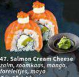
47. Salmon Cream Cheese zalm, roomkaas, mango, foreleitjes, mayo