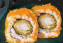
52. Ebi Masago gefrituurde garnaal, garnalenkuit, mayo